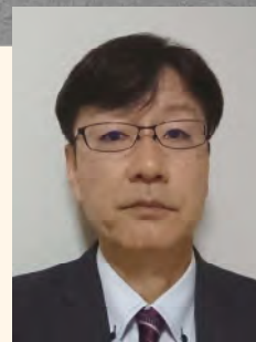
講演者 住宅金融支援機構 住まい再建支援部長