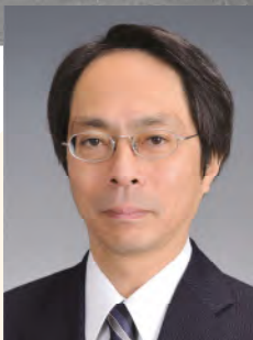
司会・ファシリテーター 耐震総合安全機構 (JASO) 理事