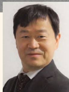
講演者 東京科学大学 環境・社会理工学院 教授