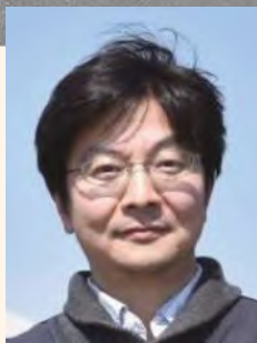
講演者 消防庁 消防研究センター 大規模火災研究室長