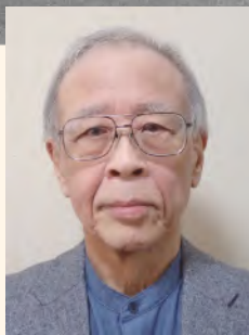
講演者 耐震総合安全機構 (JASO)